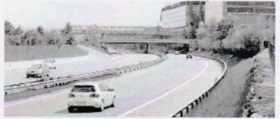
Hier in St. Gallen-Winkeln überquerte der Mann die Autobahn. DST

Das Geschehen könne nicht als Lausbubenstreich abgetan werden. «Es waren keine Jugendlichen, sondern junge Männer, die für ihre Handlung Verantwortung übernehmen