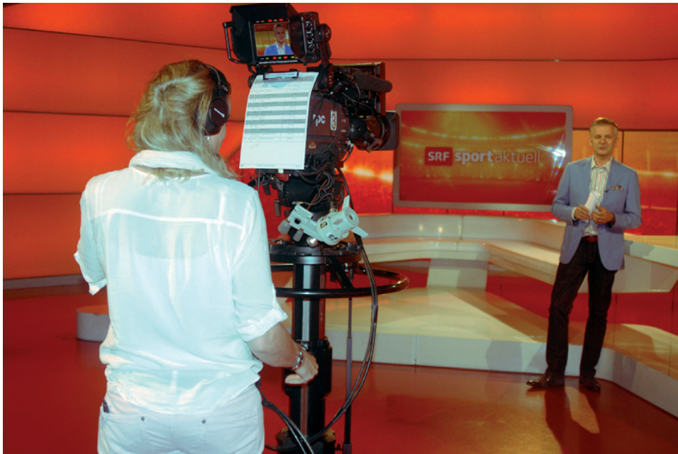
Nur einige Minuten vor dem Start nimmt Rainer Maria Salzgeber einen Trailer zur Live-Sendung auf.

Seit mehr als 20 Jahren ist Rainer Maria Salzgeber das Aushängeschild von Schweizer Radio und Fernsehen (SRF) im Fussball. Was es alles braucht, bis der Moderator eine Live-Sendung gestalten kann, zeigt der Blick hinter die Kulissen.