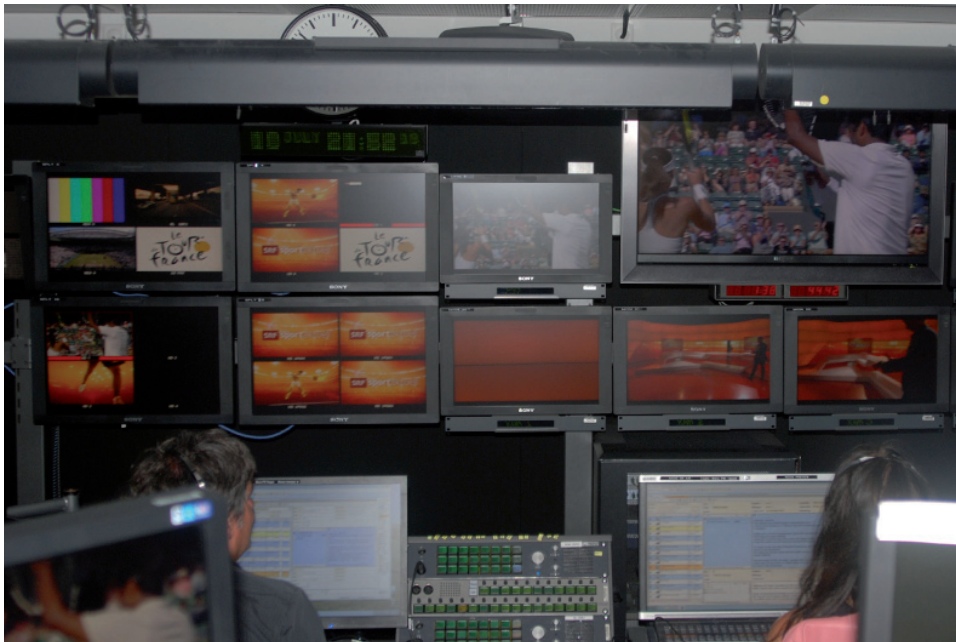
Kurz vor Beginn der Sendung im Regieraum.

Unten angekommen, öffnet er eine Tür und steht im Studio 6. Hier wird in knapp einer halben Stunde «Sport aktuell» live gesendet. Bevor es so weit ist, gilt es, einen kurzen Trailer, also eine Ankündigung der Sendung, aufzuzeichnen. Dieser wird bis zum Beginn der Live-Sendung mehrmals ausgestrahlt. Rainer Maria Salzgeber benötigt zur Aufnahme des Vorspanns lediglich zwei Anläufe, und der Text ist im Kasten. Danach verabschiedet er sich noch einmal für kurze Zeit von der Bildfläche.